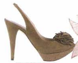
PURA LÓPEZ 300 €