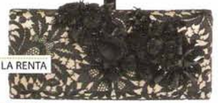
ÓSCAR DE LA RENTA