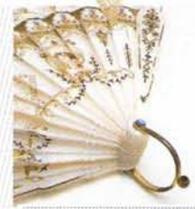
LÓPEZ LINARES ANTICUARIOS

Aunque la novia es la protagonista, el outfit de la madre siempre genera expectativa. Modelos sobrios y elegantes, que nunca dejan de ser asertivos.