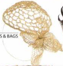
KAILIS 3.200 €