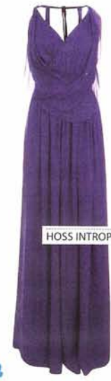
HOSS INTROPIA 360 €

Como toda lady te rendirás ante el look más sofisticado y elegante. No descartes las perlas, que vuelven para imprimir serenidad y frescura.