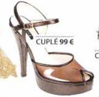
CUPLÉ 99 €