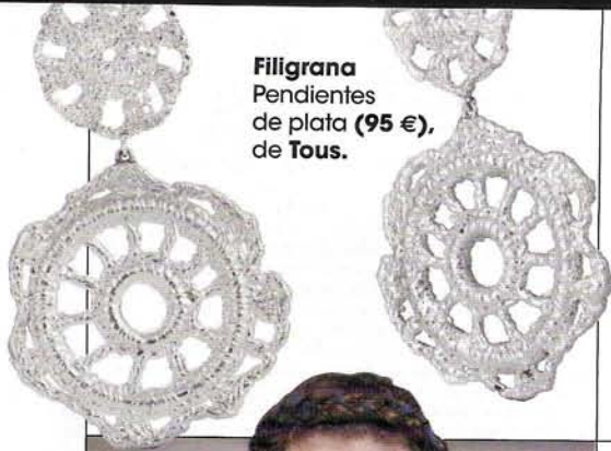
Filigrana Pendientes de plata (95 €), de Tous.