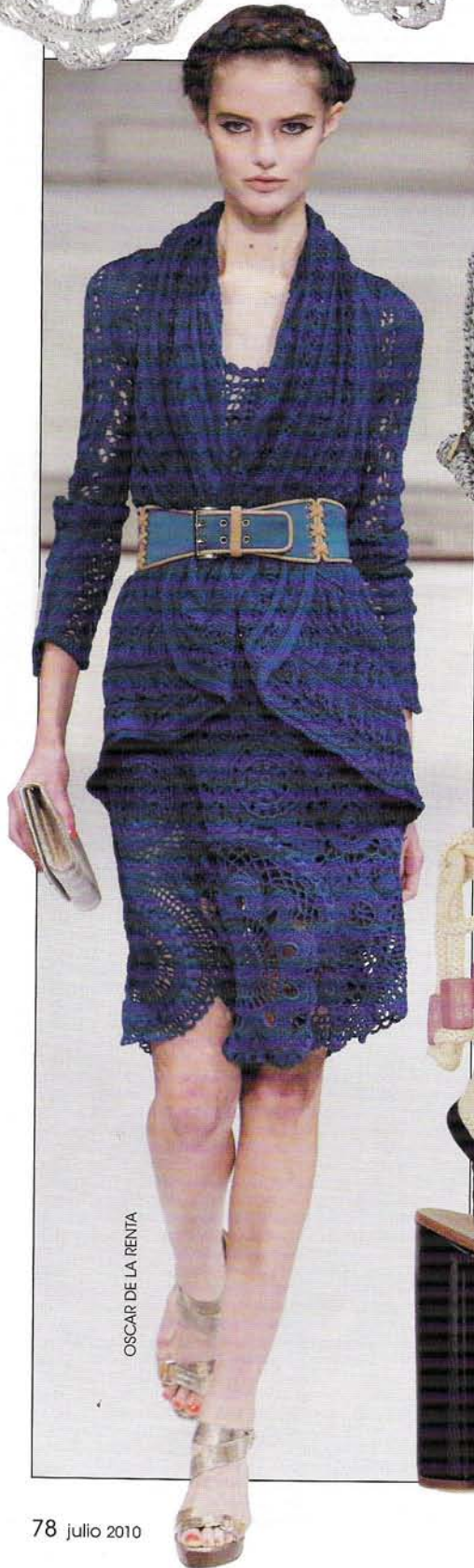
OSCAR DE LA RENTA