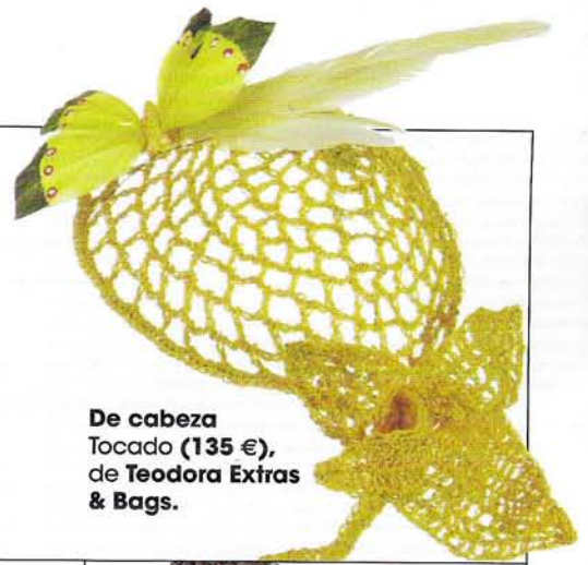
De cabeza Tocado (135 €), de Teodora Extras & Bags.