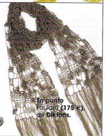
En punto Foulard (175 €), de Diktors.