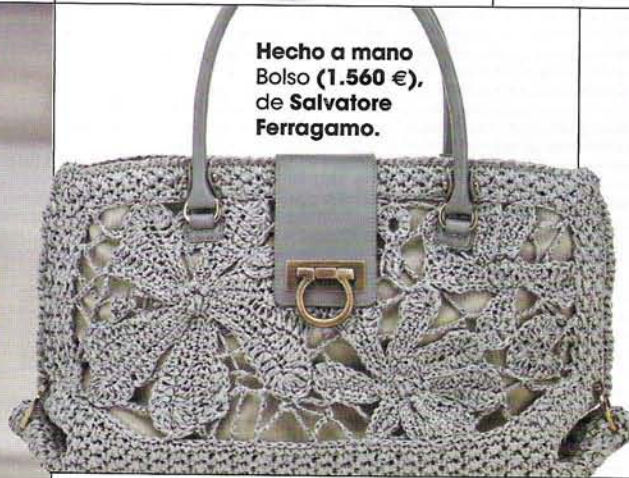
Hecho a mano Bolso (1.560 €), de Salvatore Ferragamo.