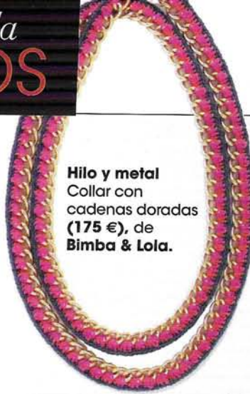
Hilo y metal Collar con cadenas doradas (175 €), de Bimba & Lola.